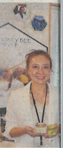
Home & Community の副社長 の(左)ドイ イ豊見城市

て、シーカーサーヤハ ッションフルーツなどの県産 素材を生かしたマヌカ蜂蜜な ど15日、豊見城市高安